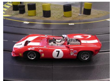
66 Lola T70 von Poldi

nicht nur neben der Strecke um die Wahl zum Fahrzeug „Best of show“ zu stellen, sondern ganz nebenbei auch noch ein Rennen zu bestreiten. So ganz ernst sollte man diese Rennen jedoch nicht nehmen, zu groß ist die Sorge um die in mühevoller Kleinarbeit aufgebauten Fahrzeuge. Und so wird dort auch ein allgemein nicht ganz üblicher Rennmodus gefahren: ganz ohne Einsetzer, wer raus ist, ist raus! So sind die Fahrer bemüht etwas vorsichtiger nicht nur mit ihrem eigenen Material umzugehen ;) Aber das tat