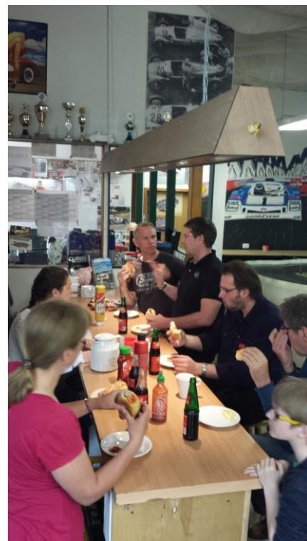
Hier geht nix ohne Wurst

Spannender dagegen wurde es dann erst auf den folgenden Plätzen: Platz 4-7 lagen alle innerhalb einer Runde, genauso wie die Plätze