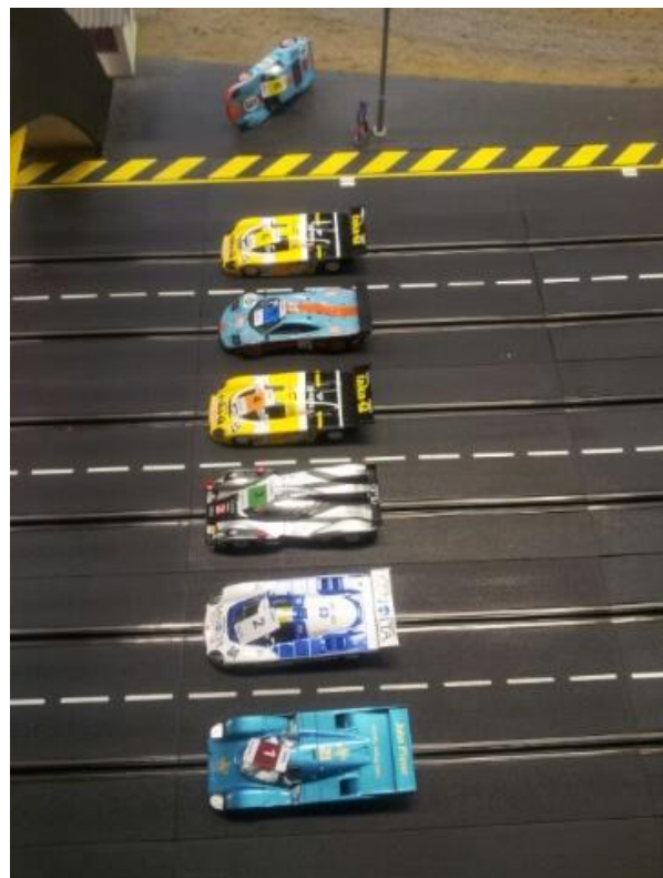
Nächster Slot.it-Lauf am 3. Mai